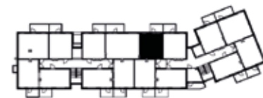
Kerros 2 ja 3