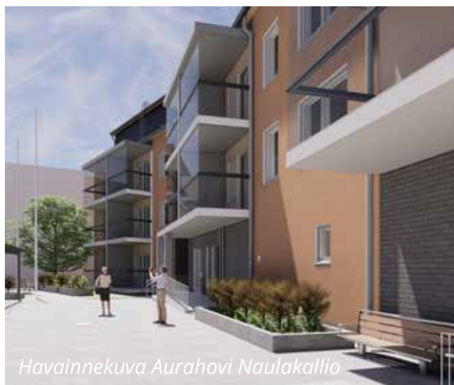
Havainnekuva Aurahovi Naulakallio