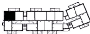
Kerros 2 ja 3